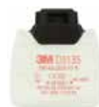
D3135 P3 R