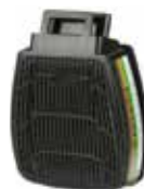
D8094 ABEK P3 R