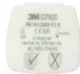
D7925 P2 R