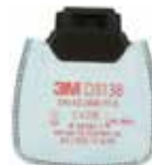
D3138 P3 R/ Vapores orgánicos y gases ácidos molestos