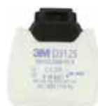
D3125 P2 R