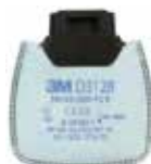
D3128 P2 R/ Vapores orgánicos y gases ácidos molestos