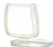
Retenedor de filtro D701

La media máscara de la serie HF-800 y sus correspondientes filtros cuentan con una resistencia a la inhalación de menos de 5 mbar, medida a 95 l/min continuamente.