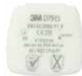
D7915 P1 R