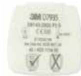
D7935 P3 R