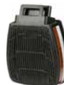
D8095 A2 P3 R